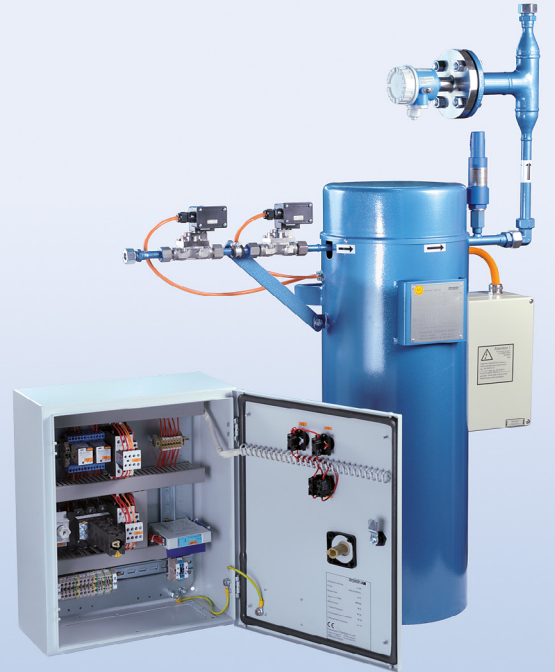
مبخرات غاز الأمونياك مع صمام الغاز السائل من طراز ETA تسخين كهربائي غير مباشر ٥ - ٣٠ كجم/ساعة