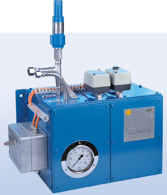
مبخرات غاز الميثانول من طراز ETM تسخين كهربائي غير مباشر ٢ - ١٢ لتر/ساعة